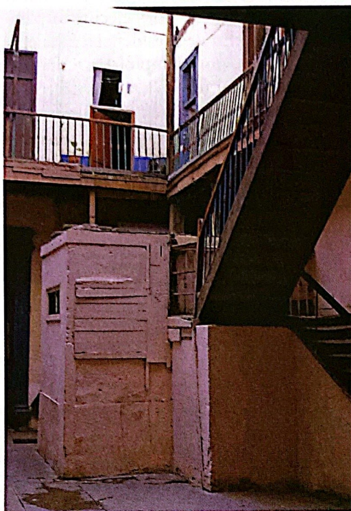
Figura 3. Servicios higiénicos insuficientes.