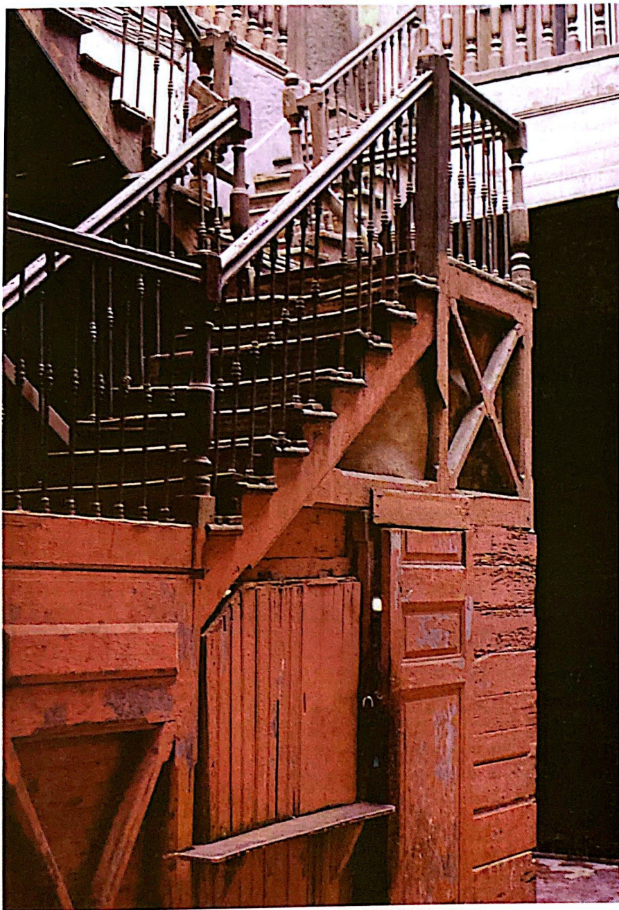
Figura 2. Material antiguo de construcción.