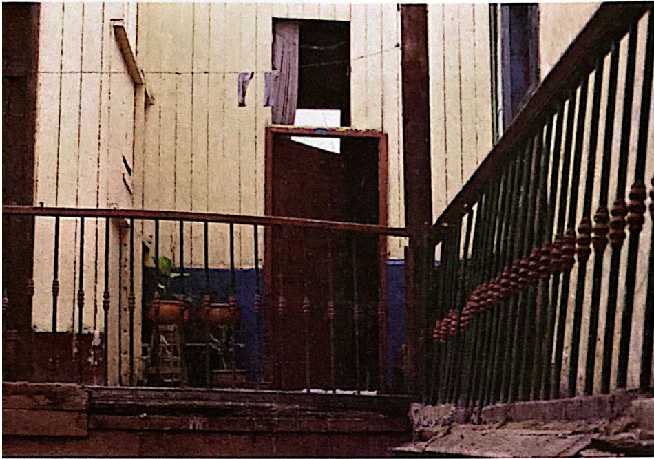
Figura 5. Deficiencias en áreas vitales por estar deterioradas.

Fuente: Revista 1/2 de construcción , 1998.