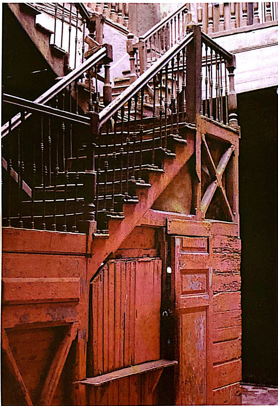
Figura 2. Material antiguo de construcción.