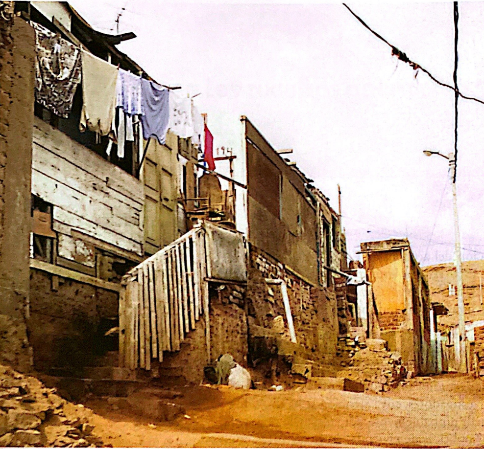
Figura 1. Precarismo.