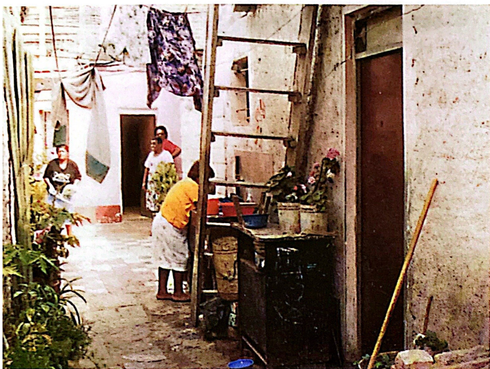
Figura 7. Falta de espacio para actividades domésticas.