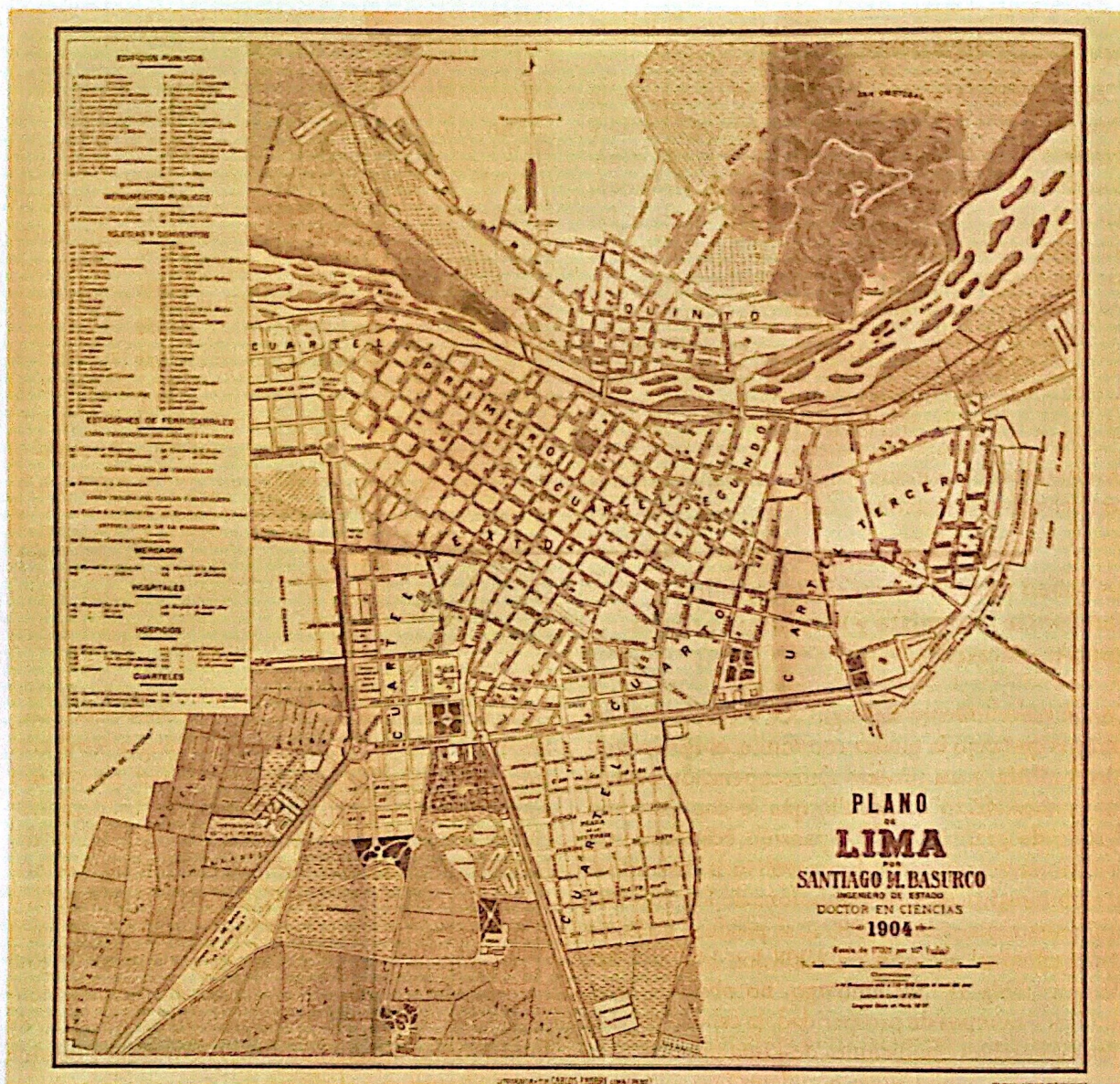
Figura 1. Plano de Lima. 1904.