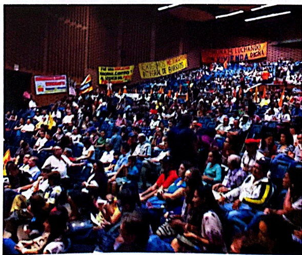
Figura 5. Masiva concurrencia al Foro Social Alternativo Popular.

Tenemos necesidad de repensar la ciudad, de pensarla bien. Espero que este relato del evento –al que no