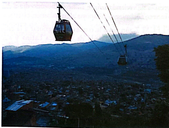
Figura 3. Teleférico.