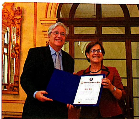
Figura 6. Alcaldesa de Lima reconoció a director ejecutivo de ONU - Habitat como Visitante Distinguido de la Ciudad.