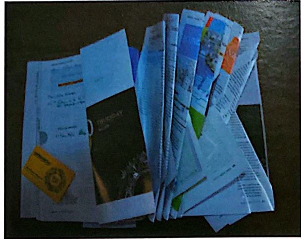
Figura 2. Programa de actividades del Séptimo Foro Urbano Mundial entregado junto a un USB con documentos de UN-Habitat a los participantes. El otro lado de la medalla.