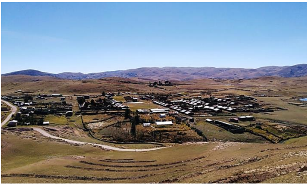
Fig. 1. Vista panorámica de la comunidad San Francisco de Raymina.

La comunidad San Francisco de Raymina (Fig. 1) tiene el acceso al servicio de energía eléctrica desde el año 2006; la energía proviene del Sistema Eléctrico (SE0068) Cangallo-Llusita, localizada a una distancia aproximada de 70 km y es suministrado por la empresa Electrocentro S.A.