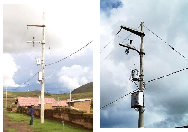
Fig. 2. Vista del transformador de distribución monofásico de 5 kVA localizado en la comunidad de Raymina.

La comunidad cuenta con energía eléctrica muy limitada, por una línea de 13.2 kV, 60 Hz, monofásico con retorno por tierra (MRT), que llega a un transformador de 5 kVA localizado en la comunidad (Fig. 2). Del transformador se distribuye con una red local, conexión aérea de baja tensión (BT), de 220 V, 60 Hz, monofásico para 35 viviendas y 5 postes de alumbrado público de 50 W c/u.