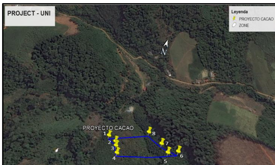
Fig. 1. Ubicación de coordenadas geográficas de los puntos de muestreo