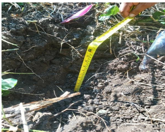
Fig. 2. Calicata de 30cm de profundidad para la extracción de muestras

La Figura 2 muestra las calicatas con una profundidad promedio de 30 cm, excavadas para la toma de muestras de suelos.