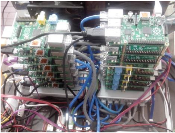
Figura 1. Dos pilas(racks) del Clúster Cruz conectados a switches

atención tanto a la energía consumida por el hardware computacional como la capacidad de enfriamiento que esto impone. La industria del hardware está ofreciendo más servidores de bajo consumo energético, a menudo usando CPUs de bajo consumo, y existe un creciente interés en el uso de chips de bajo consumo de arquitecturas alternativas tales como ARM en el centro de datos; empresas como Calxeda se han fundado en torno a estos desarrollos. Por otra parte, "Parallella: Un supercomputador para Todos" del proyecto Adapteva [4], recientemente logró reunir suficiente financiamiento comunitario que le permitirá lograr el objetivo de democratizar la computación de alto rendimiento mediante la producción de placas compactas basadas en un conjunto escalable de procesadores RISC sencillas acompañadas de una CPU ARM. En el centro de supercomputadoras de San Diego [5] usan el clúster "METEOR" basado en 16 nodos RPIs para la enseñanza y difusión de la programación paralela.