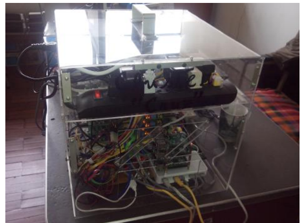
Figura 2. El Clúster "Cruz"

El Clúster "Cruz" se compone de 16 Raspberry Pi entre Modelo B y B+ que actúan como nodos esclavos más una placa Raspberry Pi modelo B+ que actúa como maestro. Estas placas son del tamaño de una tarjeta de crédito, lo cual permite su fácil manipulación y son una clase de computadores de una sola placa. Cada uno cuenta con 512 Mbytes de RAM, un sistema sobre un Chip(SoC) Broadcom BCM2835, que integra un procesador de 700MHz ARM1176JZF RISC, un GPU Broadcom VideoCore IV con salida HDMI y salida de vídeo RCA, y un controlador USB. La placa también contiene, un adaptador para puerto Ethernet externo de 10/100 Mbits, y un adaptador de dos puertos USB 2.0. El almacenamiento local se realiza a través de una tarjeta de memoria SD (Secure Digital) o microSD según el modelo de 8 gigabytes que se coloca en una ranura acondicionada para la tarjeta de memoria, y hay varias otras interfaces como buses I2C y SPI, UART y ocho pines GPIO. Cada placa RPI se alimenta con una fuente de 5 voltios que son suministrados por dos tipos de fuentes una de ellas es una fuente switching de computadora PC y los otros son adaptadores de voltaje cada uno con dos sockets USB. Comprende de 2 ventiladores para refrigeración que son necesarios porque cada placa RPI se encuentra overclocado a 1 Ghz y 1 disco duro de 160Gbytes para almacenamiento de programas y datos.