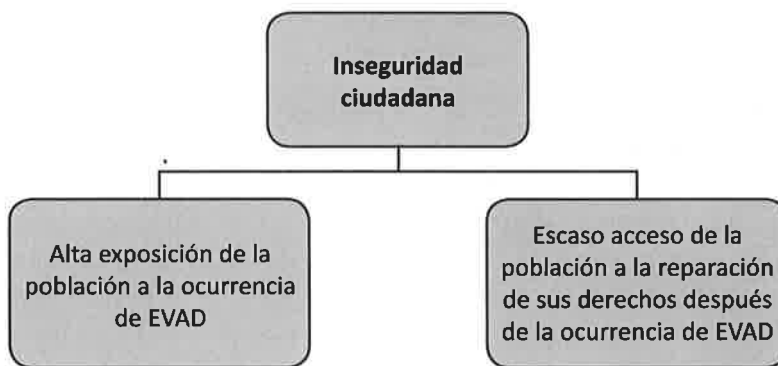
Figura 2. Explicación de la inseguridad ciudadana en sus dos causas principales.

Finalmente, se puede esquematizar que la inseguridad ciudadana tiene causas que se identifican antes de la ocurrencia de un EVAD (prevención) y después de la ocurrencia de un EVAD (atención), que se pueden desagregar en sub causas referidas a la víctima y al victimario. Esto se muestra en el siguiente esquema.