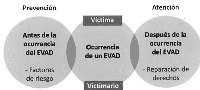
Figura 1. Surgimiento de las víctimas y victimarios

Este ordenamiento preliminar se puede definir en el siguiente esquema.