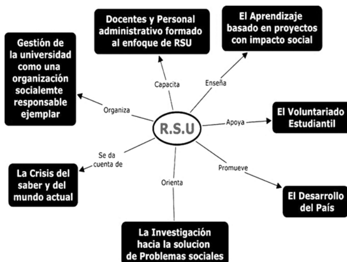
Figura 6: Reforma global de la responsabilidad social universitaria

Es importante mencionar que es un proceso gradual y se debe empezar por cambios organizacionales sencillos, donde lo principal es que la gestión interna de la universidad sea reflejo de democracia, equidad, transparencia y que se pueda realizar un modelo sostenible a futuro (Vallaey, 2009). Esto puede verse reflejado; por ejemplo, a través de la presencia de temáticas ciudadanas y de responsabilidad social en el currículo, en la integración de actores sociales externos, en el diseño de las mallas curriculares, en la protección del medio ambiente, en el uso de papel reciclado, en el tratamiento de desechos, etc.