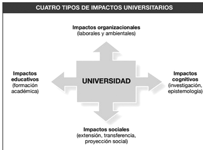
Figura 2. Tipos de impactos universitarios en el entorno Fuente Vallaey, De la Cruz y Sasía (2009)

Los tipos de impacto identificados permiten definir cuatro ejes (dimensiones) de responsabilidad social de la universidad, que es el modelo de Vallaey et al. (2009) que se explica a continuación en la figura 3.