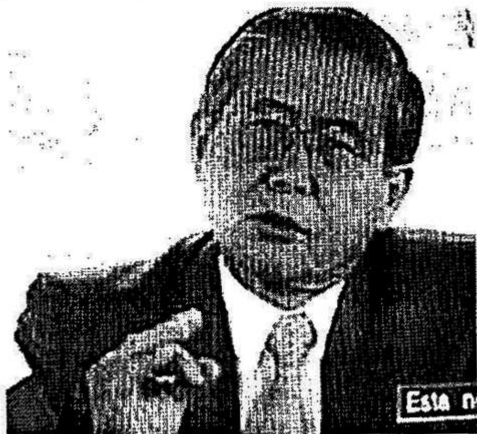
POCO INTERÉS EN LA EXTRADICIÓN DE FUJIMORI

de las elecciones regionales y municipales hayan sido desastrosos para el partido de gobierno.