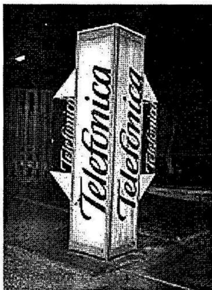
NO SE SUPRIMIÓ LA RENTA BÁSICA

se trata de una operación inútil que sólo arrojará resultados ya conocidos sobre las necesidades de capacitación de los maestros. En realidad el gobierno dispone ya de pruebas de evaluación de los maestros pues estos para nombrarse pasan una serie de exámenes.