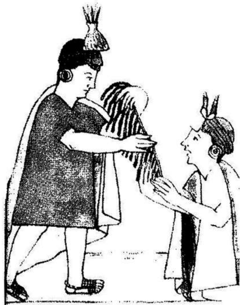
INCA RECIBIENDO INFORMES DE UN QUIPUCAMAYOC

Esas sociedades indígenas están lejos de constituir un asunto del pasado. En el Perú actual, casi diez millones hablan quechua, el idioma de los Incas 13 (un número más grande de los que hablan, por ejemplo, sueco). Casi dos millones hablan aymará (idioma de la antigua civilización Tiahuanaco, en el Lago Titicacaca, 400-1100 d.C.) o sea, el equivalente a casi el 70% de los que