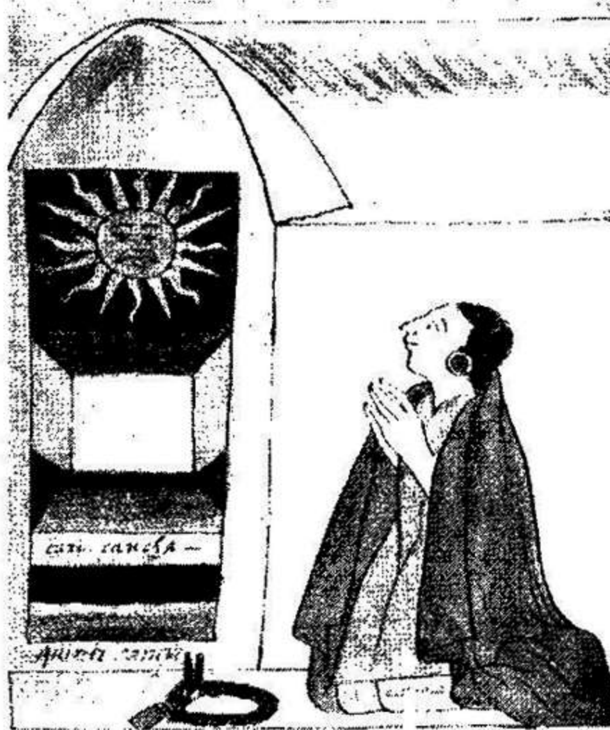
PACHACUTEC EN EL CORICANCHA

Que el principal embajador del Perú sea un venerable señor de casi 2.000 años refuerza lo que se dijo al comienzo sobre las especificidades del Perú, un país donde el presente es difícil de explicar sin la búsqueda en su remotas raíces.