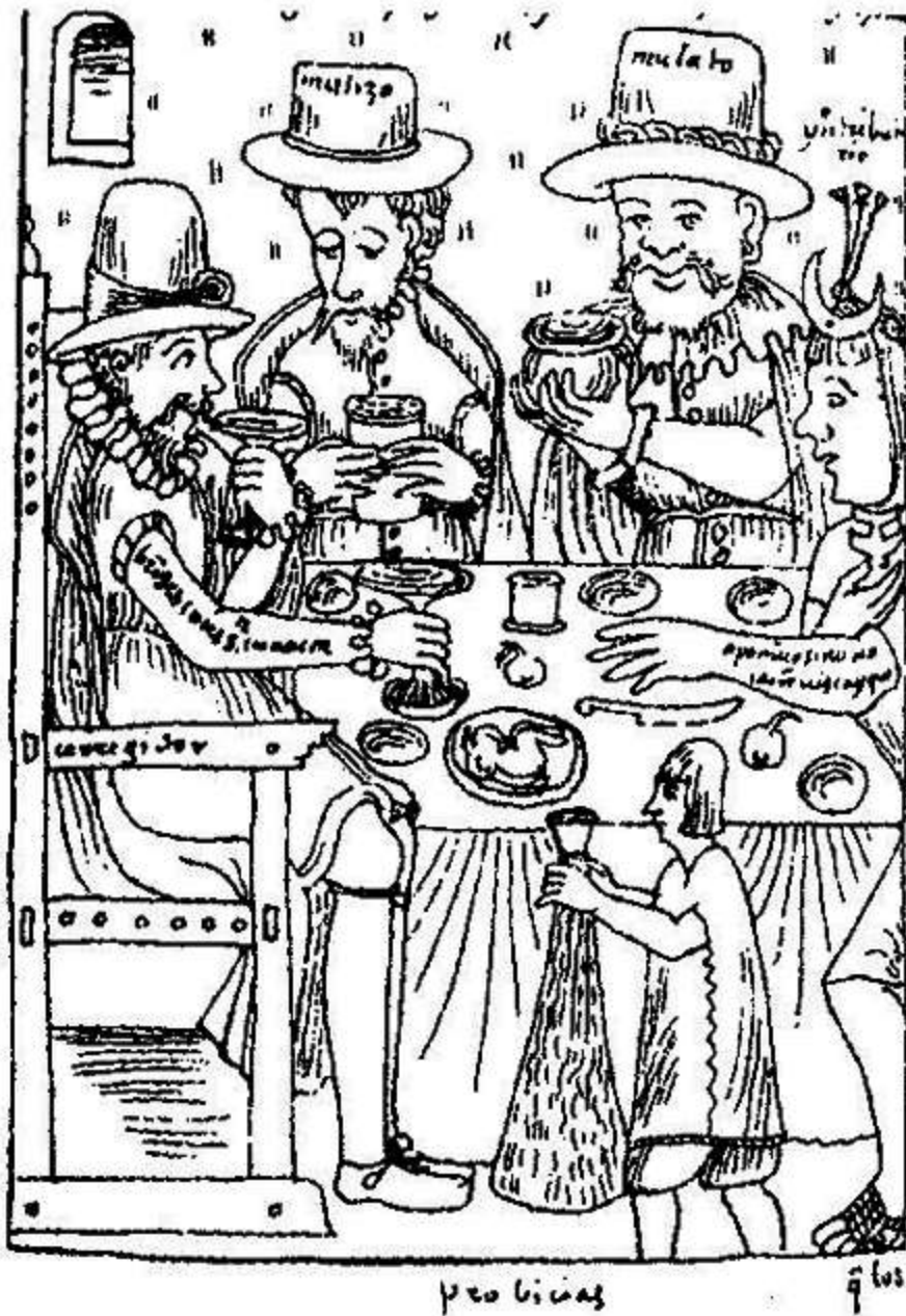
ESTRATIFICACIÓN SOCIAL REPRESENTADA POR HUAMÁN POMA

creó un partido, encontraron condiciones para llegar al poder. Y AF, además de amoral e inescrupuloso, mostró que su naturaleza era la de un oportunista, capaz de tomar ventaja de todo (constituyendo casi un modelo paradigmático del tipo de cínico peruano conocido como "criollazo"). En 1990, contra Mario Vargas Llosa, su rival en las elecciones, AF se presentó como el humilde japonés