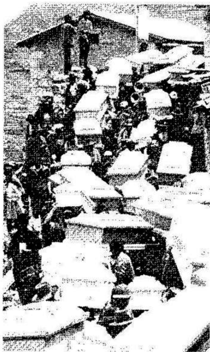
VÍCTIMAS DE SENDERO LUMINOSO EN LUCANAMARCA

Sin embargo, lo esencial para explicar el ascenso al poder de lo peor de esos grupos fue la destrucción de muchos de los mejores miembros de los mismos. Destrucción hecha principalmente por el movimiento y partido político registrado en la historia peruana como Sendero Luminoso (SL).