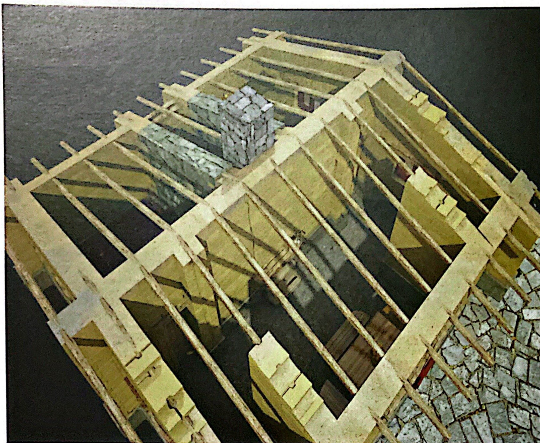
Fig. 1. Estructura del techo.