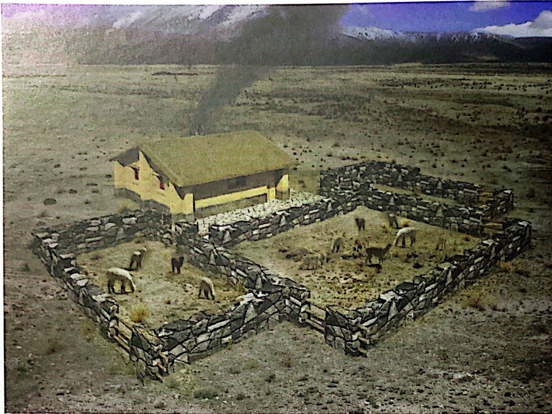
Fig. 4. Perspectiva del prototipo de vivienda