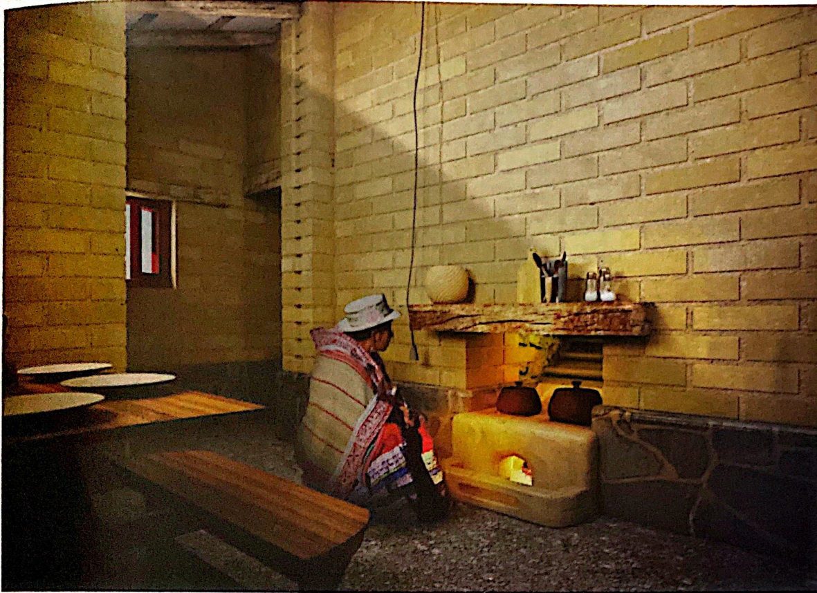
Fig. 3. Interior de la vivienda.

La expresión se entiende de la siguiente manera: