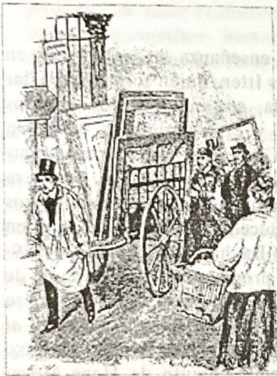
Fig. 1 y 2. La "Charrette" a fines del SXIX en la sección de arquitectura de Bellas Artes