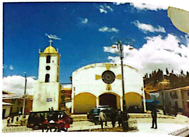
Foto 3. Iglesia de San Ildefonso de Recuay. Estado actual.

imagen de sociedad. La religión es el espacio donde se forman los grandes discursos del mundo, donde el mundo se hace –es hecho– inteligible; por ello, la explícita labor de la jerarquía religiosa de dictar pautas de comportamiento, ideas en general sobre el mundo, actitudes –predisposiciones– para que la feligresía se comporte frente a lo mundano.