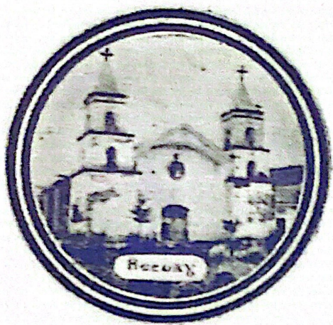
Foto 2. Iglesia de San Ildefonso de Recuay. Antecedentes.