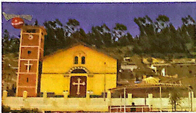
Foto 5. Iglesia Matriz de San Santiago de Aija. Estado actual.