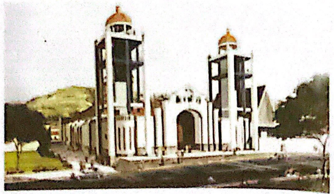
Foto 6. Nueva Catedral de Huaras. Perspectiva.

un remate que cumpla la función de cierre superior. Debe iniciarse pues la acción de rehabilitación de su fachada.