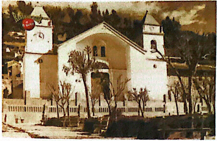
Foto 4. Iglesia de San Santiago de Aija. Antecedentes.

concluyendo en 1965 (ver Foto 1). Pero la tranquilidad de los huaracinos va a ser turbada por un acontecimiento externo, el terremoto de 1970, que daña severamente la catedral, por ello Comisión de Reconstrucción y Rehabilitación de la zona afectada por el sismo del 31 de mayo de 1970 (CRYRZA) ordena su demolición. Francisco Gonzales (1992), ex Director del INC - filial Ancash, describió la iglesia de la siguiente manera: