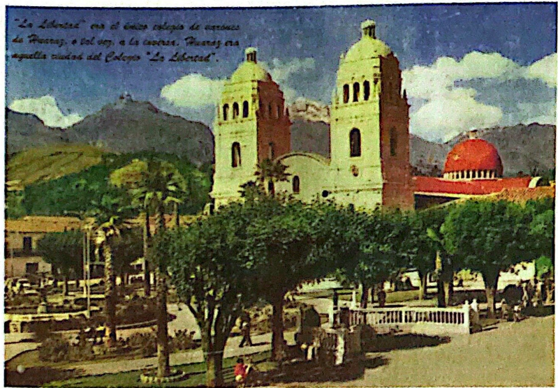
Foto 1. Catedral de Huarás antes del sismo de 1970.