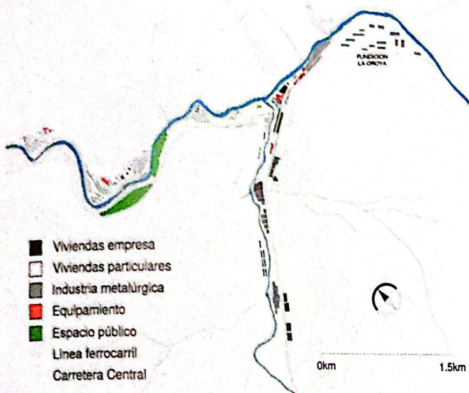
Plano 3. La Oroya: Plano urbano de 1973

del país desde inicios del siglo XX, la industria forjó una infraestructura y costumbres que perduran.