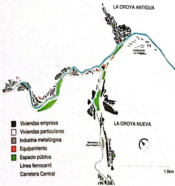
Plano 4. La Oroya: Expansión urbana 1998

La Oroya tiene dos centros de producción, la Fundición y la Refinería Huaymanta, ambos con una fascinante arquitectura en metal.