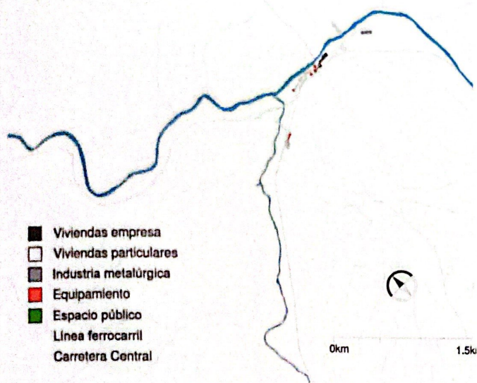
Plano 1. La Oroya: La Villa y el Ferrocarril Central (1893-1922)

Los Huancas apoyaron la invasión española del Imperio Inca, las buenas relaciones entre los curacas y los españoles derivaron en beneficios territoriales, donde La Oroya formó parte de dicha repartición. Francisco Pizarro arriba al lugar en 1533 después de cancelar la fundación del Perú en Jauja, se sorprende con la presencia de la “oroya”, especie de cesto que permite el paso por el Jatunmayu (río Mantaro). Los invasores pernoctan para descansar y buscar metales preciosos en minas próximas al área, atribuyendo desde entonces el nombre La Oroya.