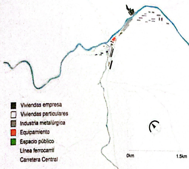
Plano 2. La Oroya: Company Town 1950.

En la administración estatal en las décadas de 1970 y 1980 se densifica la ciudad, se añaden nuevos trabajadores en un manejo informal, desordenado y corrupto. La Oroya crece en desorden en las laderas de los cerros, expectantes a la traza de la Company town, en un hacinamiento caótico. La explosión demográfica de la ciudad es una realidad que se extiende aceleradamente en el distrito de Santa Rosa de Sacco contiguo a la Carretera Central, en dirección a Lima y en menor desarrollo en el distrito de Paccha. La dinámica urbana entre los tres distritos establece la conurbación que se reconoce hasta hoy. 6