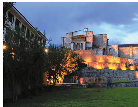
Figura 10. Explanada Koricancha (Actual).

Él no tenía reparo en corregirse a sí mismo, –esto quería y ahora ya no quiero, y esto se hace así-. (...) pero el saldo era muy positivo, era un gobernante como no ha tenido Cusco después; creo que los otros alcaldes que han venido no han tenido ni la iniciativa ni el brío que tenía él para hacer las cosas (Samanez, comunicación personal, 21 de junio de 2018).