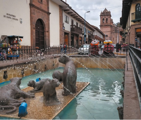
Figura 4. Plazoleta de Santa Catalina. Archivo fotográfico personal de los autores, 2018.

urbano). –Yo, le dije– “este no es un lenguaje de aquí, cómo vamos a poner estas cosas acá, y se molestó”. Finalmente, muchos de los proyectos los mandó a realizar con la oficina de proyectos de la Municipalidad. (Comunicación personal, 21 de junio de 2018)