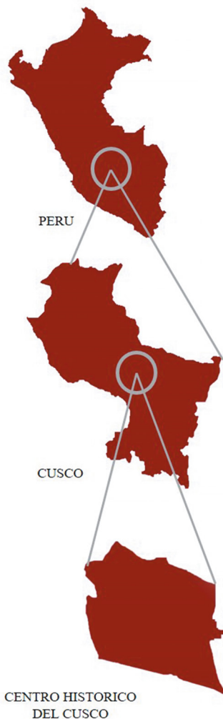
Figura 1. Ubicación geográfica multiescalar de Cusco y su Centro Histórico. Elaboración propia del grupo investigador, 2020.

La región Cusco se encuentra ubicada en la sierra sur central andina del Perú a 3.399 m.s.n.m. Se divide en 13 provincias entre ellas la provincia de Cusco, ciudad que posee un Centro Histórico en el que se evidencia una trasposición de expresiones culturales (ver Figura 1).