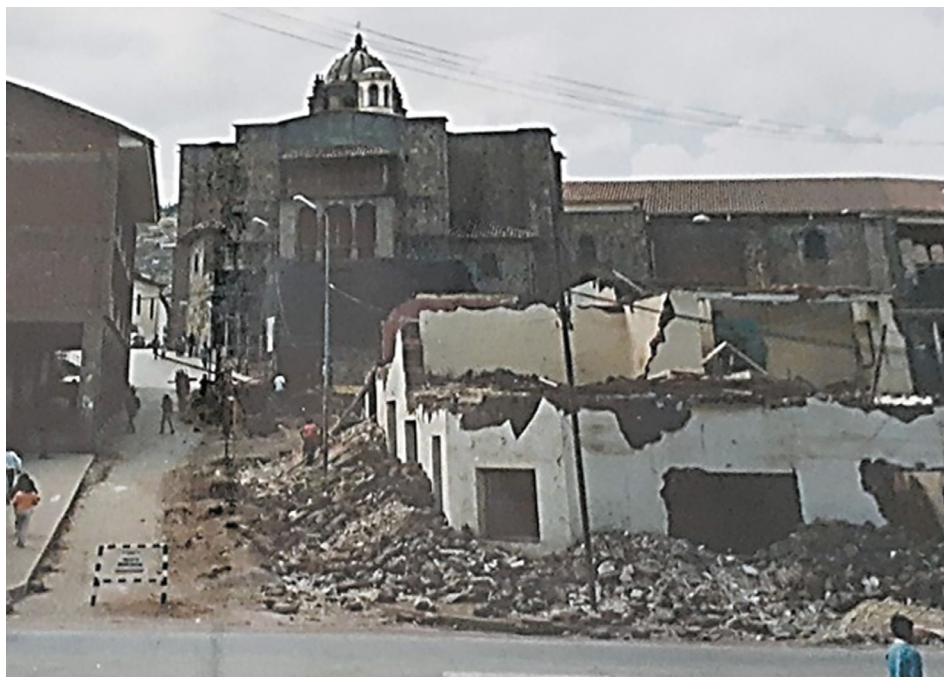
Figura 8. Explanada Koricancha (proceso de expropiación de terrenos, 1992). Archivo de la Dirección Desconcentrada de Cultura-Cusco. Foto tomada por el grupo investigador, 2019.