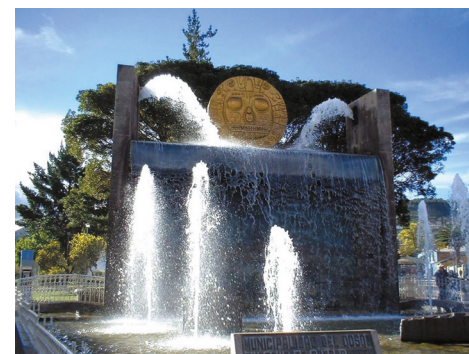
Figura 6. Paqcha de Pumaqchupan.

Las obras de pavimentación que se iniciaron el año 90, correspondían a las calles Nueva Alta, Nueva Baja y Vitoque. La pavimentación con adoquinado se inició “en la esquina de la calle Hospital -San Pedro hasta la confluencia con Arcopata [...] Compondrán también los trabajos de instalaciones subterráneas de energía eléctrica, agua y desagüe, alcantarillado, o sea que se hará simultáneamente todas las obras”. (El Comercio, 1990, pp. 1,4) La obra se efectuó a solicitud de los vecinos y se inauguró el 28 de enero de 1991 considerando la pronta atención de la Comuna Provincial.