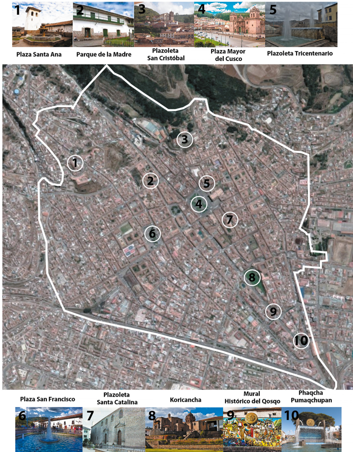
Figura 15. Intervenciones en espacios públicos. Elaboración propia, 2020.