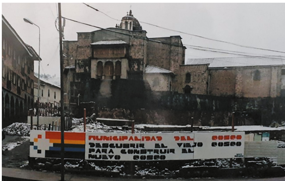
Figura 9. Explanada Koricancha (Proceso de demolición, 1992).

Para el mes de diciembre, la Municipalidad, tenía bajo su propiedad el 75% del área total de terrenos llegando a pagar al presidente y gerente de la Cooperativa, un total de 150 mil dólares. “El alcalde reiteró que todas estas expropiaciones, las hace el Concejo con recursos propios. Lamentó que el Gobierno Central no haya contribuido con