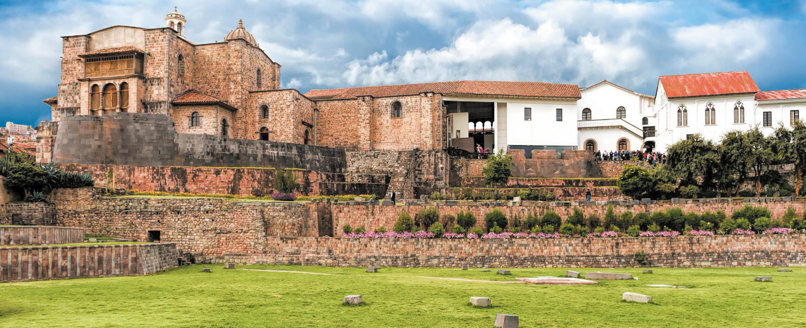
Figura 11. Explanada Koricancha (Actual).

Claro está que los cusqueños querían a su ciudad como un museo viviente, conservador.