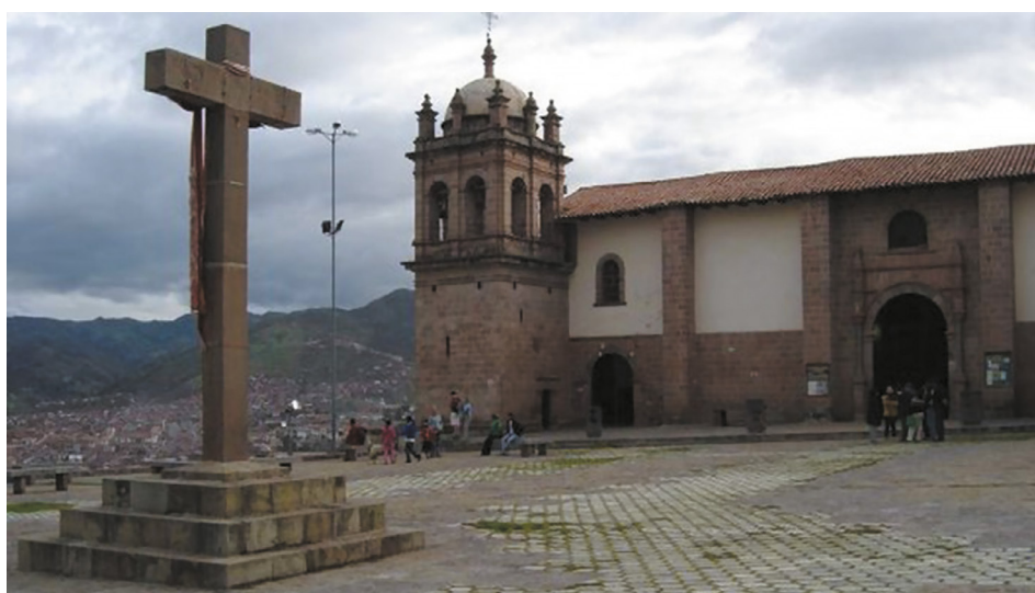
Figura 14. Barrio de San Cristobal (Ccolcampata) Actualidad.