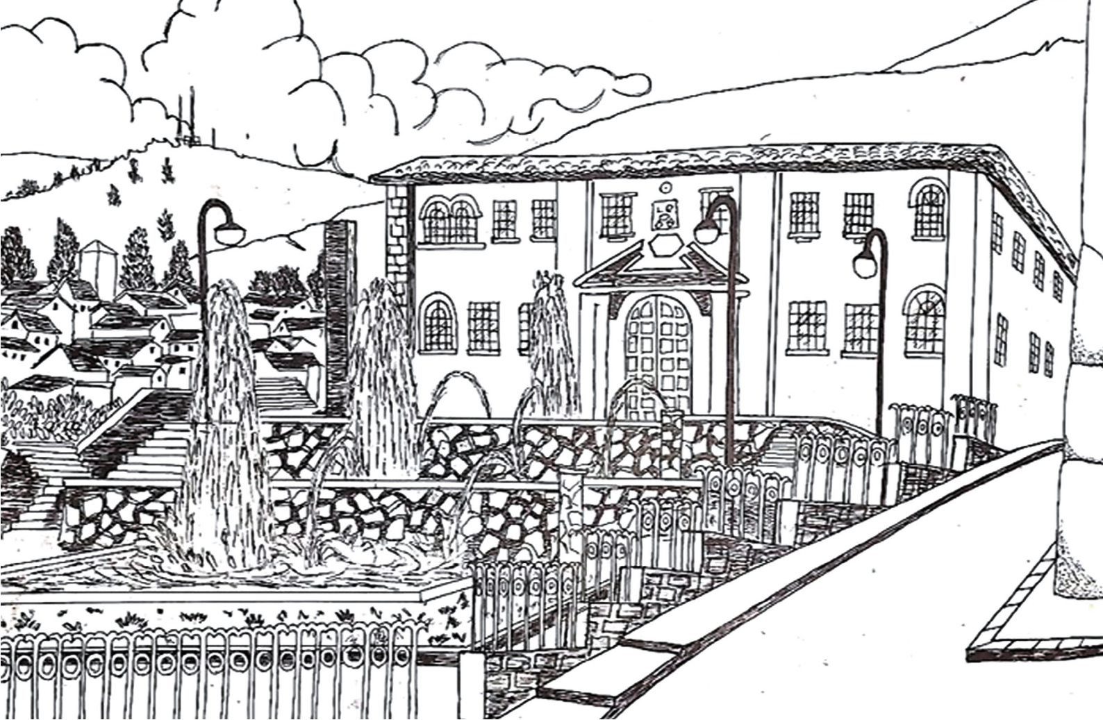
Figura 5. Plazoleta del Tricentenario. Archivo de la Municipalidad del Qosqo – Urpicha, 1995.

conexión de diversos corredores turísticos, de barrios y calles con la Plaza Mayor de Cusco. Así pues, mediante Resolución de Alcaldía N° 806, la Comuna Local oficializaba la aprobación de la propuesta alcanzada por la Dirección de Transporte Urbano, Transito y Circulación Vial, el cual consistía en establecer nuevas rutas de circulación para el servicio de transporte urbano de pasajeros. “Municipio estableció nuevas rutas para transporte urbano” (El Comercio, 1991, pp. 1,4) Fueron tres los circuitos aprobados, el tercero, recorría las calles de una parte del Centro Histórico.