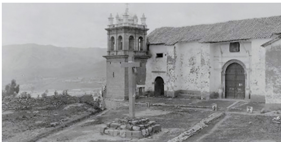
Figura 13. Barrio de San Cristóbal (Ccolcampata 1905).