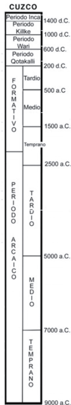
Figura 2. Cuadro cronológico de ocupación prehispánica de Cusco. (Bauer, 2008, p.35).

Los monumentos, obras arquitectónicas, de escultura o de pinturas monumentales, elementos o estructuras de carácter arqueológico, inscripciones, cavernas y grupos de elementos, que tengan un valor universal excepcional desde el punto de vista de la historia, del arte o de la ciencia. (UNESCO, 2014, p. 134)