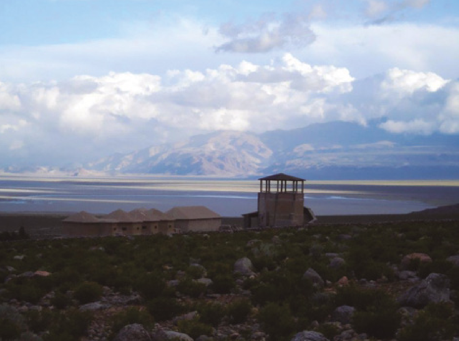
Figura 2. Uno de los Sitios Panorámicos de Interpretación dentro del Museo Integral, desde donde se observa parte de la inmensidad de la reserva territorial.

El Museo Integral, por tanto, muestra así a los visitantes un acercamiento a los aspectos religiosos, lingüísticos, de organización social y de organización económica de Laguna Blanca, incluyendo toda una serie de actos y situaciones ceremoniales en consonancia con tradiciones de raíz prehispánica (Delfino, et al, 2012) (ver Figura 2).