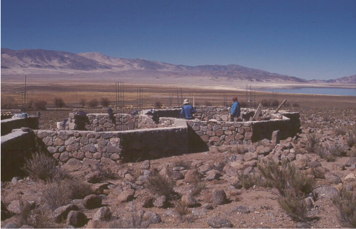
Figuras 3. Construcción del Centro de Recepción e Interpretación (CRI).