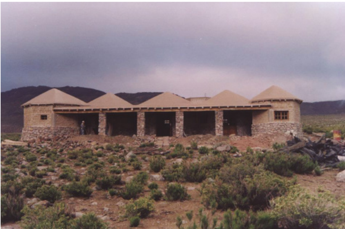
Figuras 4. Resultado final de la construcción del Centro de Recepción e Interpretación (CRI). 2019.