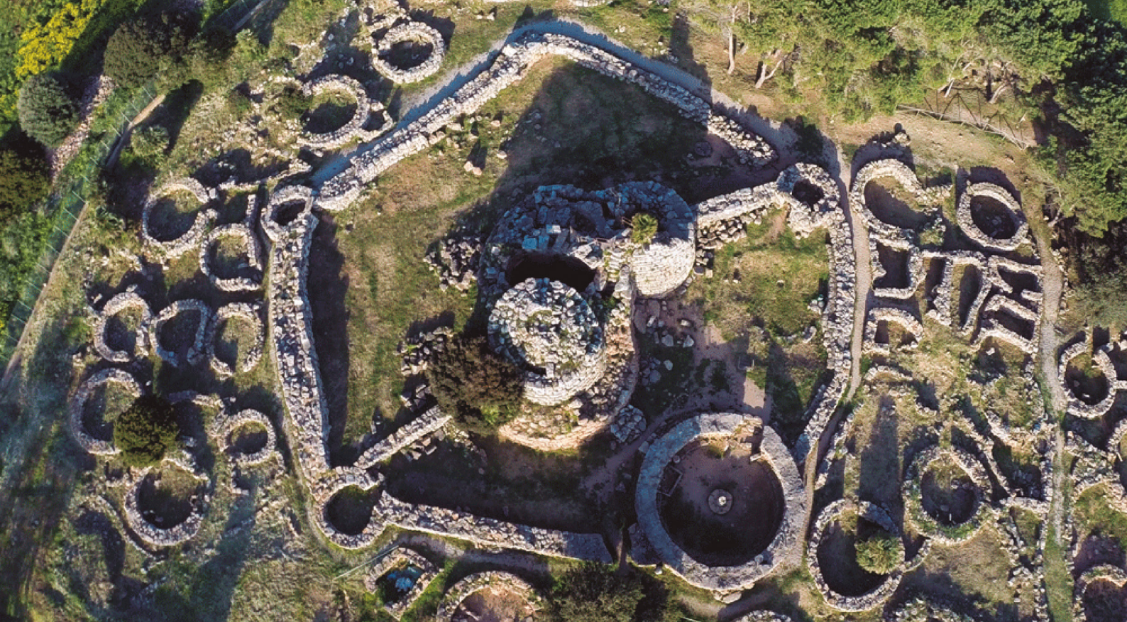
Figura 1. Sitio nurágico de Palmavera en Alghero.

No solo la creación del TM cambió en los primeros años de funcionamiento el panorama turístico de la isla, pues el turismo era su principal fuente de ingresos, sino que se pretendían otros logros positivos, como la creación de nuevos puestos de trabajo para jóvenes desempleados, quienes se encargarían de la gestión de los distintos centros. A pesar de todo ello, seguían persistiendo problemáticas como: la falta de una estructura central de gestión territorial, puesto que había demasiadas unidades y falta de coordinación entre los centros y las administraciones. Ejemplos de ello eran los fallos en la señalización del recorrido, la falta de delimitación de las zonas de aparcamiento o que no se alcanzara un consenso en las estrategias de promoción. Como recalcan Miró y Padró, tiempo después de comenzarse la creación del proyecto y del concepto de TM en Alghero, éste se difuminaba: