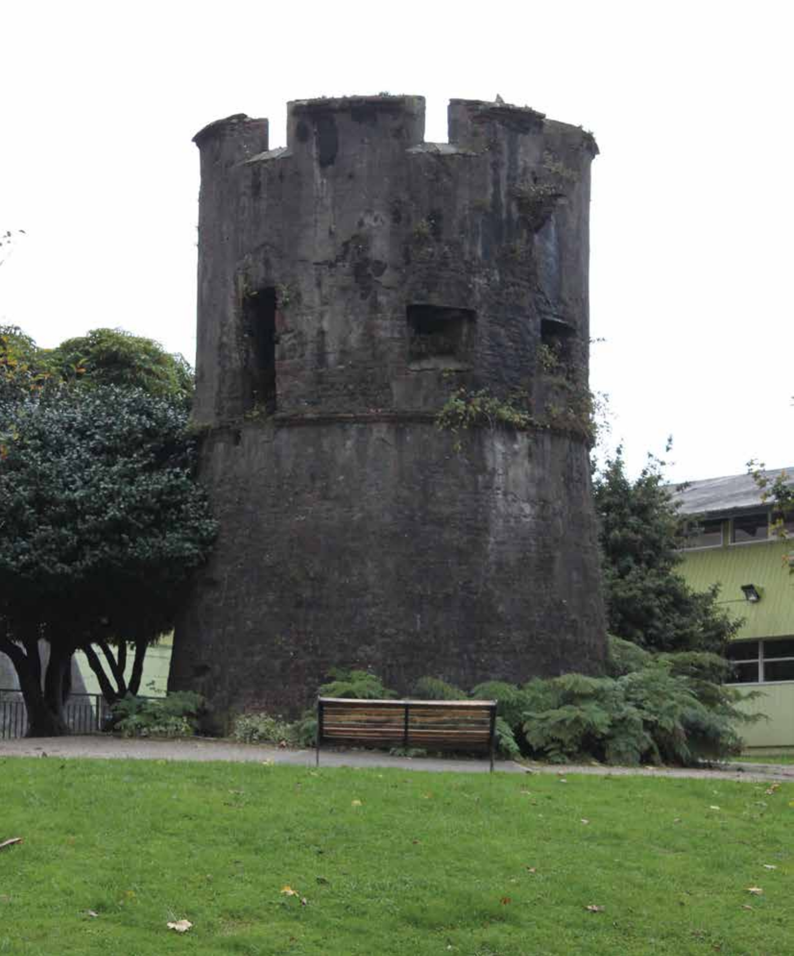
Figura 6. Torreón del Barro, ubicado en el sector oriente de la muralla.