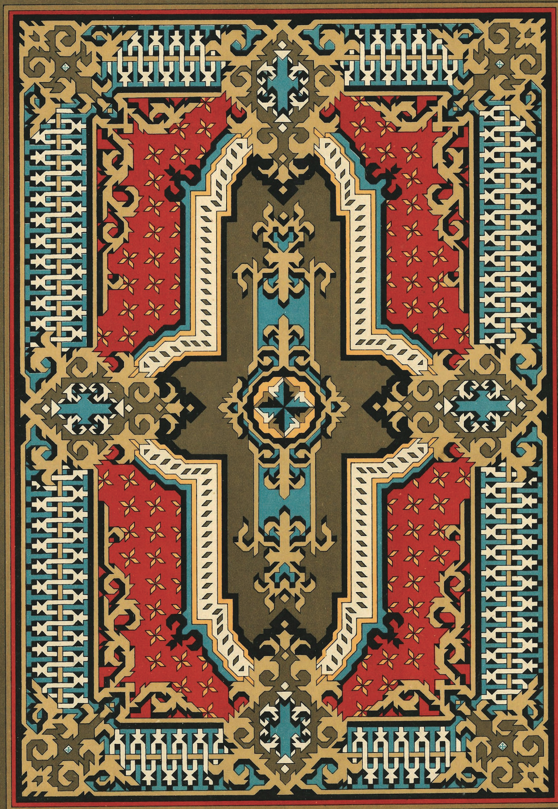
Figura 5. Página de un catálogo original de la fábrica. Fondos documentales del CIDCeN, 1899.

Escala de 1 á 24 HIJOS DE MIGUEL NOLLA VALENCIA.