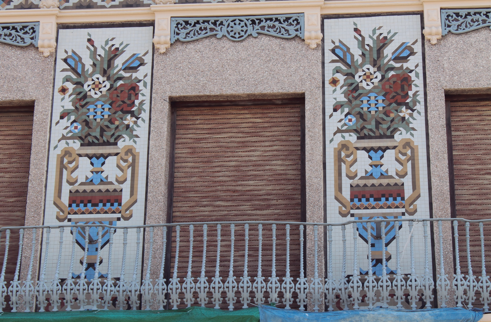
Figura 13. Fachada con mosaicos Nolla de complicado diseño representando jarrones con flores.