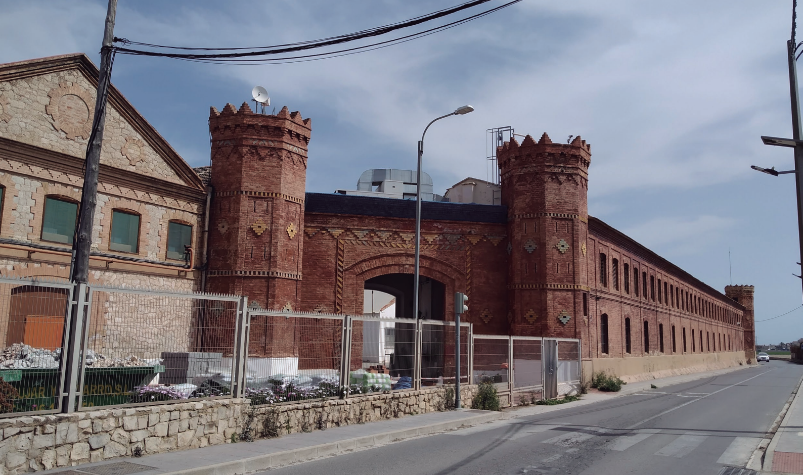
Figura 1. Entrada de la fábrica de mosaicos Nolla actualmente.