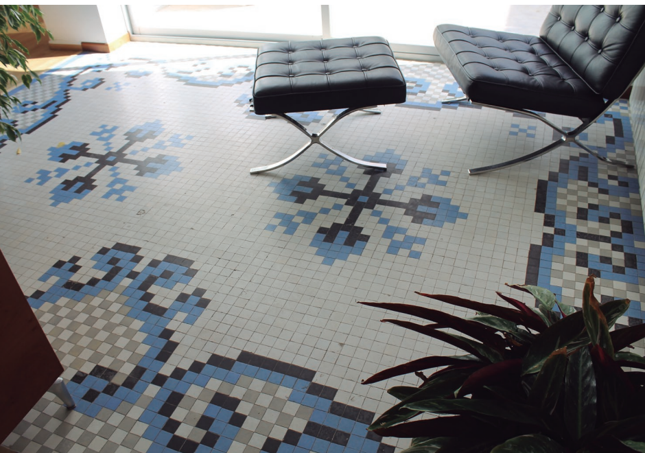
Figura 6. Ejemplo de mosaico que incluye la flor de cuatro pétalos en su diseño.