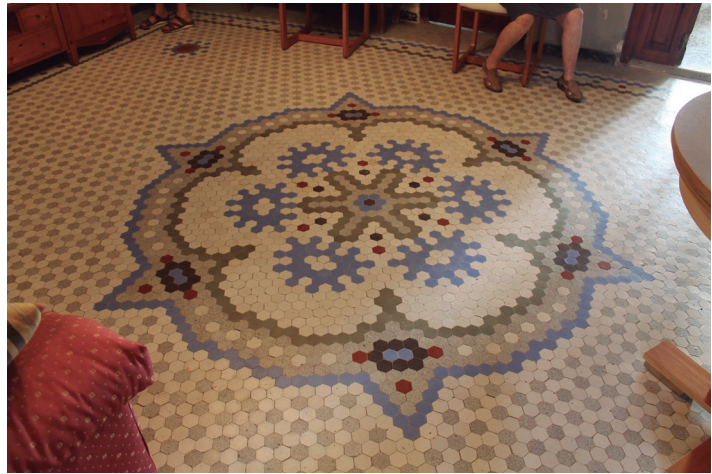
Figura 10. Ejemplo de mosaico con motivos azules sobre fondo blanco.