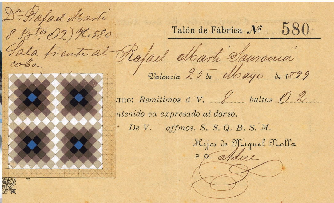
Figura 9. Ficha pintada y manuscrita para colocar este diseño en casa de un cliente. Fondos documentales del CIDCeN, 1899.

b) Pequeñas cruces y cuadrados: Este diseño de tipo continuo, normalmente con perímetro, también es muy recurrente en las viviendas del pueblo (ver Figuras 8 y 9).