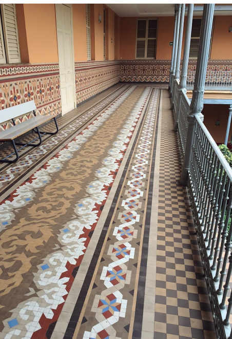
Figura 2. Mosaicos Nolla del claustro del antiguo Asilo de San Juan Bautista, actual campus de la Universidad Católica de Valencia. Fondos documentales del CIDCeN, 2015.

En la segunda mitad del siglo XIX, la fábrica de mosaicos Nolla empezó su producción en Meliana (Valencia, España), provocando una revolución en el modo de vida de la zona, que permitiría el desarrollo económico y demográfico de los municipios de la región. A finales de ese mismo siglo, la empresa fundada por el Sr. Nolla había alcanzado una gran fama a nivel internacional, gracias a la calidad y la belleza de sus productos, que le permitieron competir en el mercado europeo más exigente. El mosaico Nolla estaba de moda y, por este motivo, fue un recurso muy utilizado para enriquecer algunos de los edificios más importantes de la época, así como para adornar viviendas privadas, hasta su cierre en la década de 1970 (ver Figura 1).