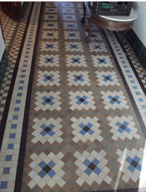
Figura 8. Ejemplo de mosaico con el diseño de cruces y cuadrados.