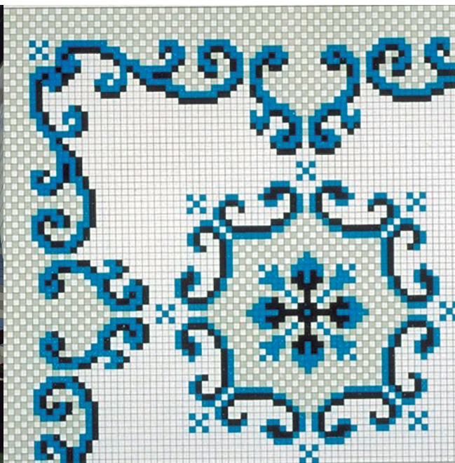
Figura 7. Referencia en el catálogo. Fondos documentales del CIDCeN, 1929.

Tras el inventariado de casi 60 casas de Meliana se catalogó una gran diversidad de diseños, de calidades y de ubicaciones de mosaico (pavimentos, bienes muebles, fachadas, peldaños de las entradas, cisternas, terrazas, etc.). Por tanto, para realizar este estudio se decidió acotar por motivos de extensión, y analizar solo los mosaicos de los pavimentos sitos en las casas privadas, que son los que presentan las modificaciones propias de la clase trabajadora, dejando a un lado los ejemplos de otro tipo de edificios, como los de la iglesia o del ayuntamiento.