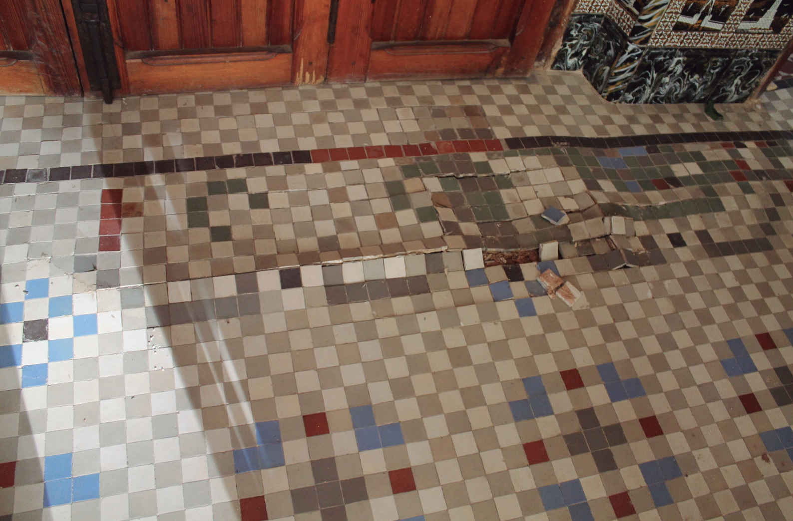
Figura 12. Abombamiento que ha derivado en rotura del mosaico.

Por último, podemos añadir, a modo de curiosidad, que en algunas casas se han podido observar losetas con marcas de producción, que probablemente se utilizaron después de ser descartadas en la fábrica para abaratar los costes.